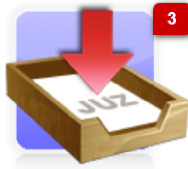
Preingresos del Juzgado